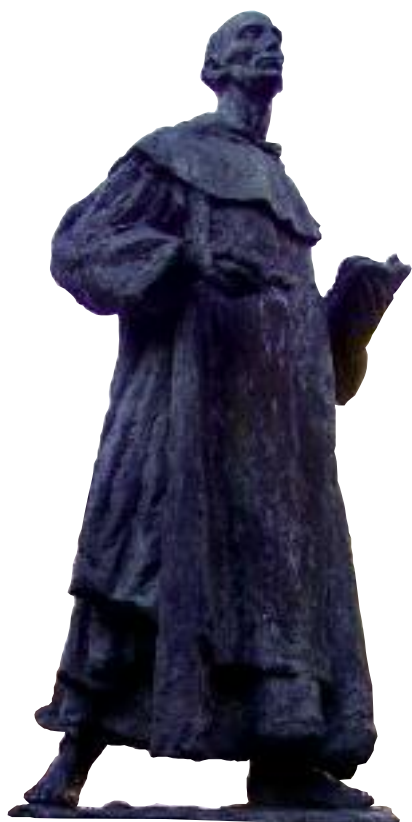
Escultura de San Juan de la Cruz, del escultor José M a García Moro