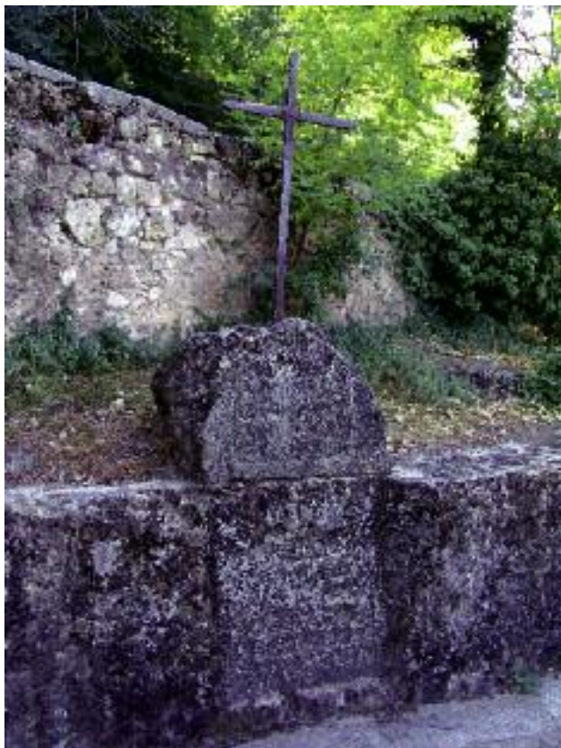
Lugar de descanso de San Juan de la Cruz