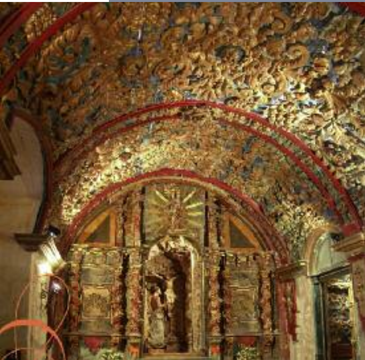
Cueva de Santo Domingo, en el interior de Santa Cruz la Real

La Santa Cueva es independiente del monasterio. Tiene entrada por una puerta lateral de aquél y da sobre la zona del ábside de la gran iglesia. Un breve jardín y un pórtico sencillo que da acceso al interior de la capilla; en una segunda capilla está la oquedad que constituye la primitiva cueva, en la que hay una imagen de Santo Domingo arrodillado, mirando una cruz y golpeándose el pecho (puede datar de 1600). También hay otra imagen del santo, esculpida por Sebastián de Almoacid, que data de los tiempos de los Reyes Católicos. La Santa Cueva sigue siendo propiedad de los dominicos, y puede ser visitada avisando previamente en el monasterio de las Madres Dominicas.