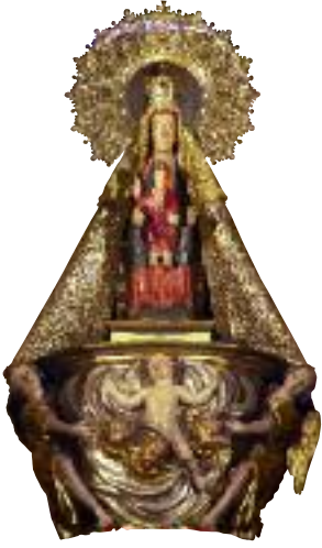
Virgen de El Henar