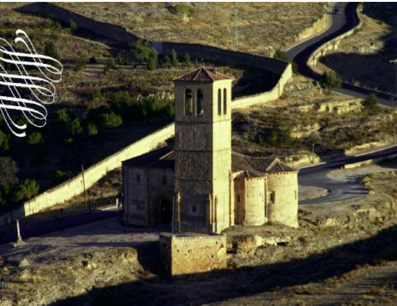
Iglesia de la Vera Cruz