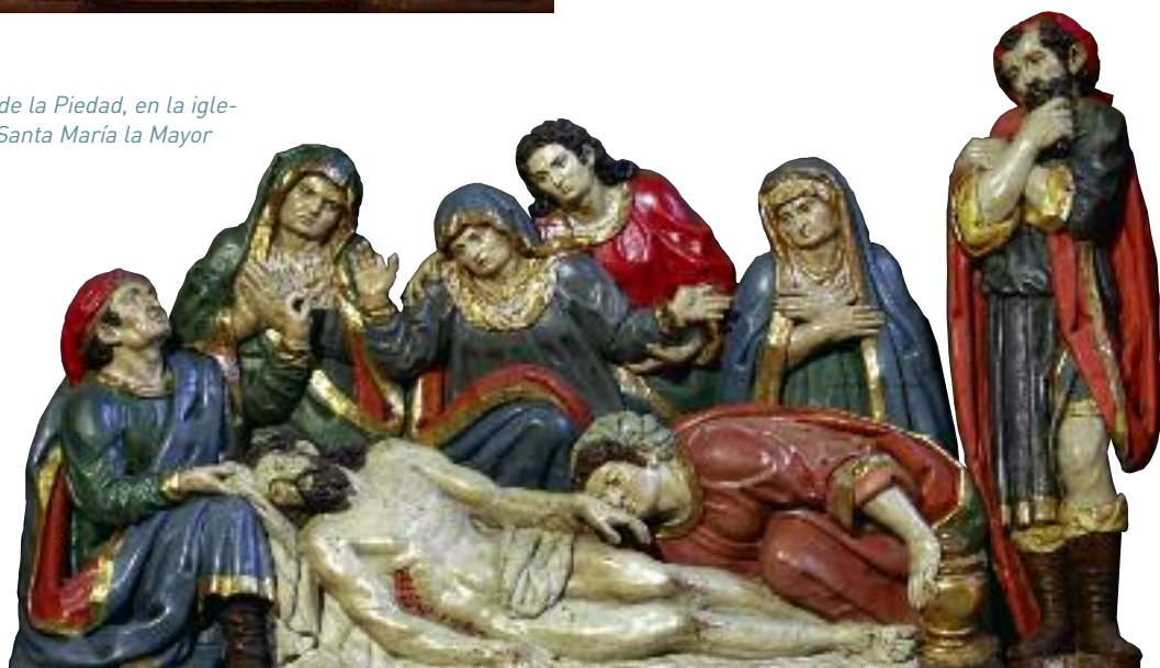
Grupo de la Piedad, en la iglesia de Santa María la Mayor

Cabe recomendar la visita a Fuentepelayo en las fiestas de la Octava del Corpus, en cuya procesión se portan la custodia y cruces antes mencionadas, celebrándose asimismo una fiesta popular muy típica y ancestral.