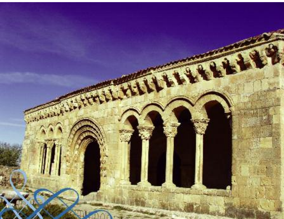
Iglesia de San Miguel