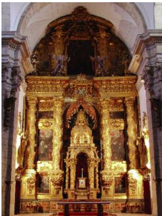
Retablo del Seminario