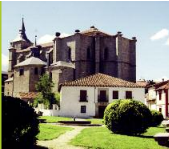
Iglesia de San Eutropio