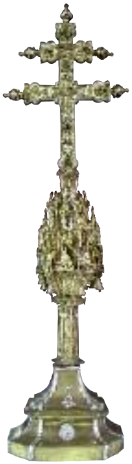
Reliquia de la Santa Cruz