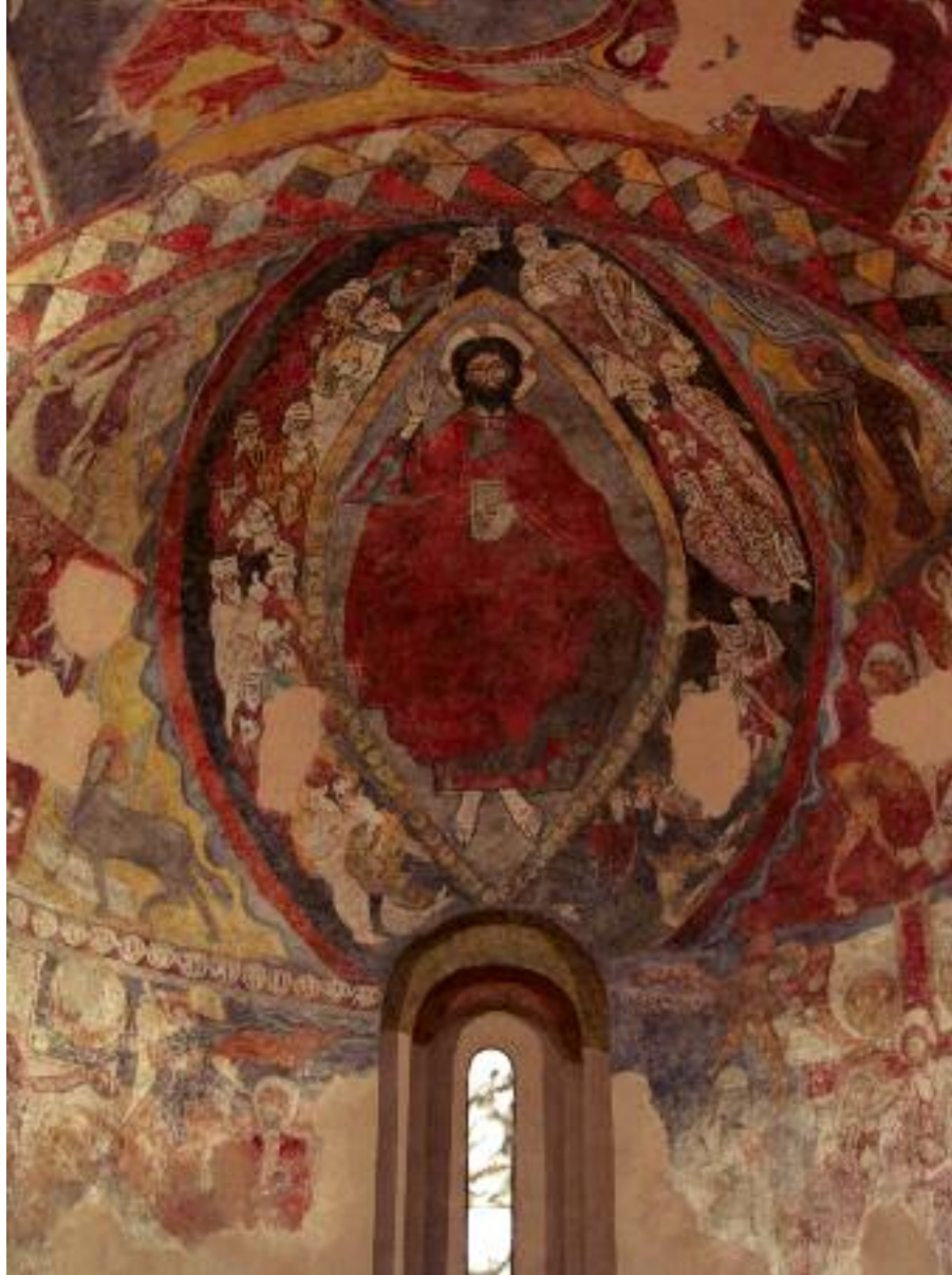
Pinturas románicas en el ábside de la Iglesia de San Justo