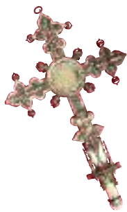
Relicario con el fragmento de pizarra

Fue enterrada en esta iglesia doña Blanca de Navarra, hija de Carlos III y esposa de Juan II; recientemente se ha avivado una polémica sobre si pudieran ser suyos unos restos hallados, tema sobre el que todavía nada se ha concretado.