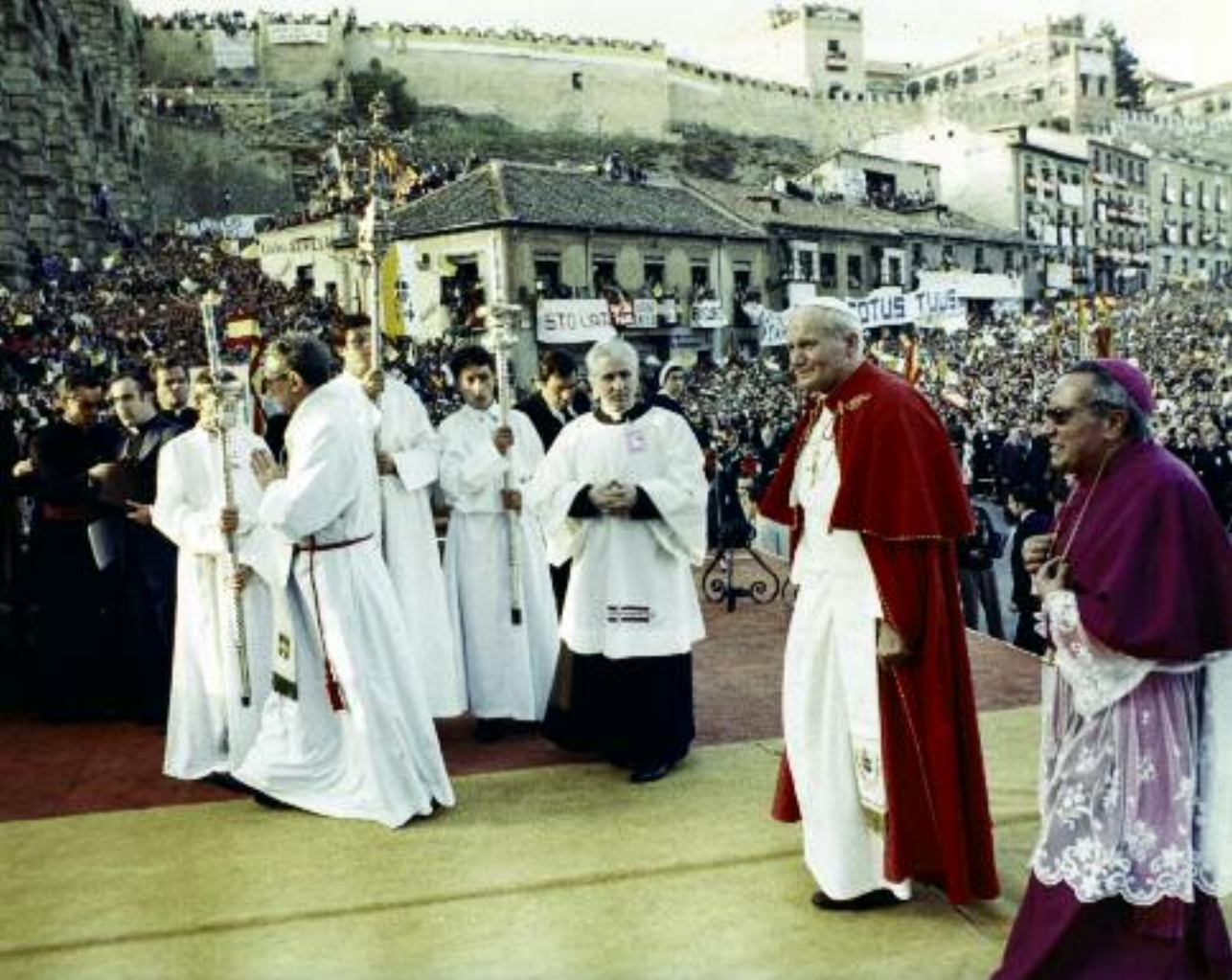
Visita del Papa Juan Pablo II en 1982

Después de visitar la original iglesia de La Vera Cruz ó Los Templarios, recorreremos un corto trayecto hasta la Alameda de la Fuencisla, donde aparece la gran escalinata que nos lleva hasta el convento de los Padres Carmelitas ; en una capilla del templo se encuentra el altar con la urna que conserva los restos de San Juan de la Cruz , fundador de este convento en 1586, a cuya construcción contribuyó con sus manos y del que fue primer prior. En la misma capilla, en el suelo, aparece descubierto el hueco que acogió los restos del santo hasta la construcción del actual mausoleo, en 1927. También hay en el convento un cuadro con la imagen de Cristo que la tradición dice que habló al santo mientras oraba ante él; asimismo, una imagen de San Juan que se atribuye a Gregorio Fernández. En la amplia huerta, desde la que se contempla un impresionante panorama de Segovia, y en su parte más alta, hay dos ermitas, en una de las cuales se dice que el santo místico compuso algunos de sus más bellos poemas, posiblemente, entre ellos su “Llama de amor viva”. En la Semana Santa se celebra un multitudinario Vía Crucis por los caminos de este huerto. El finado Papa Juan Pablo II, el 4 de noviembre de 1982, oró ante el sepulcro de San Juan de la Cruz, al que tenía gran devoción.