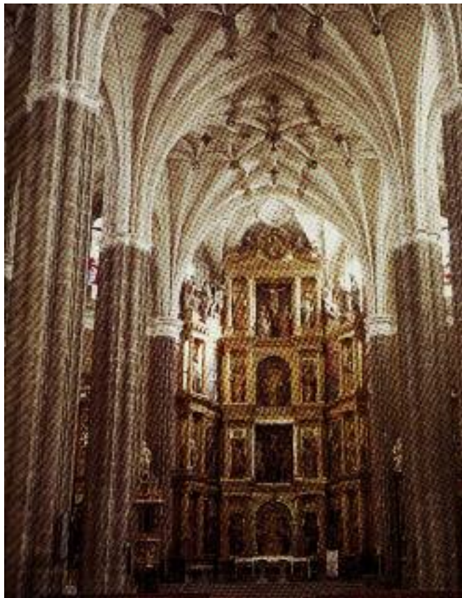
Retablo de la Iglesia de San Sebastián

El Convento de Nuestra Señora de los Ángeles , cuyas obras se iniciaron en 1621, tiene en su altar un retablo renacentista con un lienzo con Santa Clara y San Francisco. Continúa en el convento la comunidad de Clarisas Franciscanas que le ocupa desde 1632.