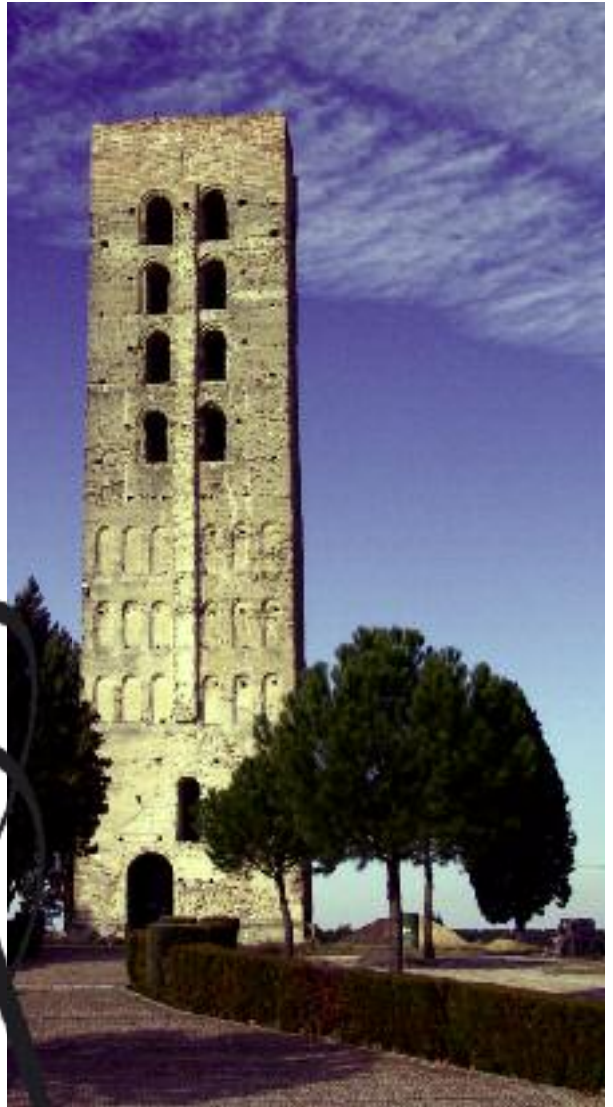
Torre de San Nicolás

La villa, que fue lugar de nacimiento del emperador Teodosio, tuvo siete parroquias, de las que únicamente se conservan la gran y esbelta torre de la de San Nicolás , y la iglesia de Santa María , de principios del siglo XVI; el amplio interior alberga varias obras de arte, destacando los cuatro sepulcros de la familia Fonseca (a la que se debe la construcción del famoso y bello castillo mudéjar), que son un valioso conjunto de escultura renacentista en mármol de Carrara, debidas al cincel del escultor burgalés Bartolomé Ordóñez.