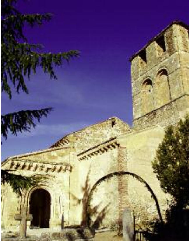
Iglesia de San Miguel

Sotosalbos está estrechamente vinculado a la figura del Arcipreste de Hita, que en su “Libro de Buen Amor” señala expresamente su devoción por este lugar, situado frente al puerto de Malagosto, en el que tuvo el famoso encuentro con La Chata, según su relato.