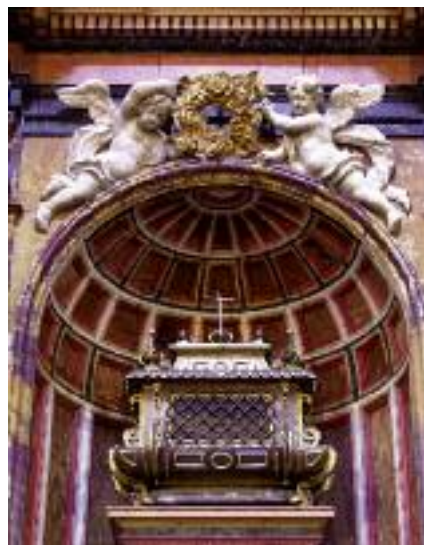
Urna con los restos de San Frutos, en el trancoro de la Catedral