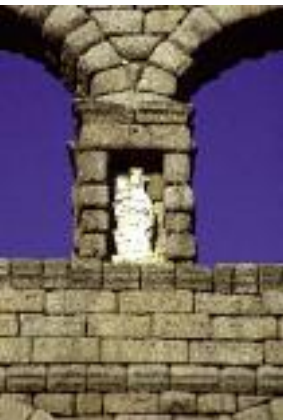
Hornacina con imagen de la Virgen en el Azoguejo

En el interior del templo debemos admirar un magnífico Cristo Yacente , que se atribuye a Gregorio Fernández, parece que con toda razón; un pequeño pero muy valioso museo exhibe un magnífico tríptico flamenco de Adrián Rembrandt, dos bustos-relicarios de San Marcos y San Lorenzo, una preciosa talla de San Francisco de Asís, de Pedro de Mena, y otras no menos importantes pinturas e imágenes.