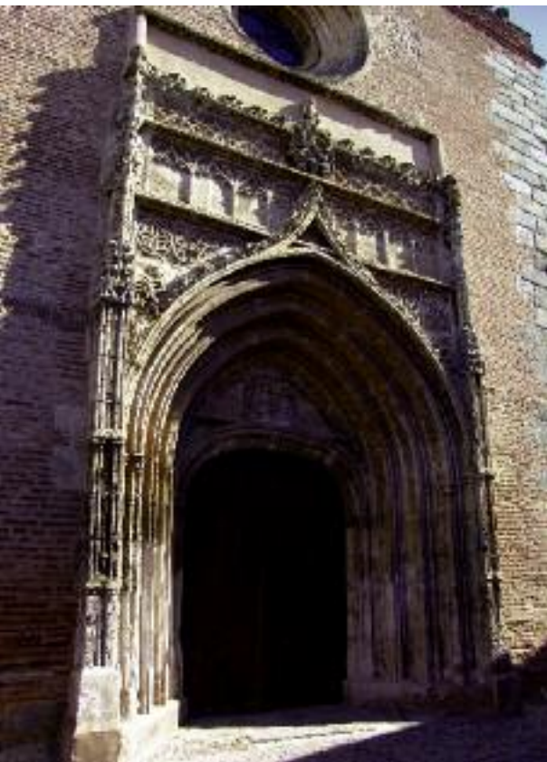
Portada Occidental de la Iglesia Parroquial de Martín Muñoz

Se atribuye el origen de esta población a Martín Muñoz, caballero acompañante del Cid Campeador en su destierro, cuyo nombre aparece con reiteración en el Poema del Mio Cid. Hay una gran plaza en el centro de la localidad, en parte porticada, a un extremo de la cual se conserva el Palacio del Cardenal Espinosa , construcción de estilo herreriano, con un espléndido patio. En el lado opuesto, la iglesia parroquial con tres puertas de estilos diferentes correspondientes a tres épocas. El interior ofrece una gran cantidad de atractivos, como los bellos sepulcros, uno de ellos del Cardenal Espinosa con estatua orante del mismo debida a Pompeyo Leoni; varios retablos de los siglos XVI y XVII; un Cristo Yacente de Francisco Díaz de Tudanca, discípulo de Gregorio Fernández; bellísimas pinturas románicas al templo de los siglos XIII y XV y un cuadro de El Greco , La Crucifixión, conservado en buen estado y protegido por cristal. Junto a las imágenes de Cristo, la Virgen y San Juan, está, en posición orante, la del párroco de Santo Tomé de Toledo, a quien le regaló el cuadro el artista. Este Greco siempre ha sido el orgullo del vecindario, que le defiende a capa y espada, por lo que, para asegurar su protección y que no saliera de la localidad, durante unas obras realizadas en el templo entre 1982 y 1999 permaneció custodiado en el cuartel de la Guardia Civil.