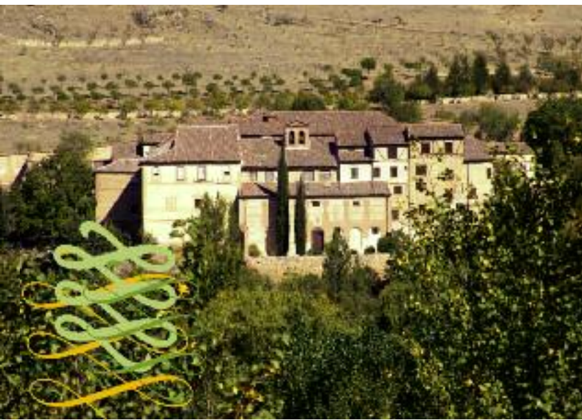
Monasterio de San Vicente el Real

la que hacía penitencia Santo Domingo , convertida en pequeña capilla y en la que Santa Teresa de Jesús permaneció en éxtasis, conversando con el santo fundador, el 30 de septiembre de 1574. Se dice que la santa manifestó que había un gran parecido entre el santo con el que mantuvo el coloquio espiritual y la escultura que se venera en la oquedad situada sobre el pequeño altar.