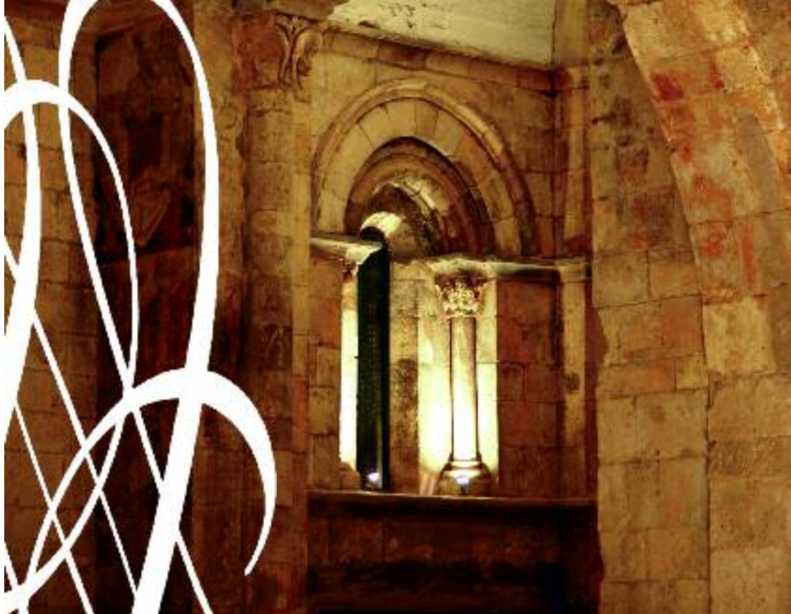
Ábside interior de la Iglesia de San Juan de los Caballeros