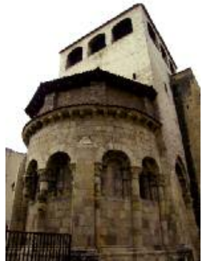
Ábside de la Iglesia de San Clemente

Fray Vicente llegó a Segovia el 3 de mayo de 1411, fiesta de la Invención de la Santa Cruz, y encontró en el lugar un gran gentío, que muy probablemente estaba allí para celebrar la colocación del “mayo”, un poste de gran altura, costumbre al parecer de origen pagano pero que fue absorbida por el catolicismo; la fiesta sigue celebrándose a los pies de la ermita. Por deseo de San Vicente Ferrer se levantó aquí una pequeña ermita, pero en el siglo XVII fue derruida para sustituirla por la actual. Tiene un retablo del maestro Churriguera, y en cuanto a la imagen del Cristo, no se tiene fecha concreta, aunque se supone que fue donado a primeros del siglo XVI. En 1863 se trajo de Roma una reliquia de San Vicente Ferrer, que se conservaba en un relicario de metal blanco, hoy en paradero desconocido.