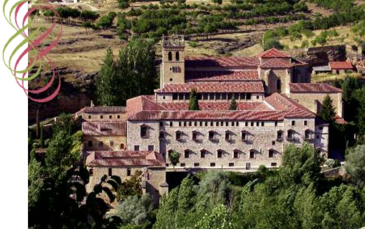
Monasterio de Santa María de El Parral

quedaremos iguales”. La frase causó suspicacias entre los tres hombres, lo que aprovechó el marqués para herir a dos, mientras huía el tercero. El marqués prometió construir un monasterio dedicado a la Virgen.