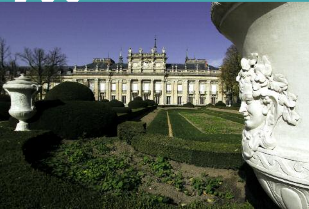
Palacio y Jardines de La Granja de San Ildefonso