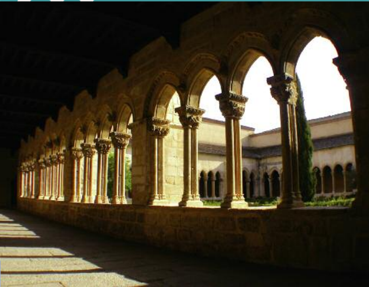
Claustro del Monasterio de Santa María