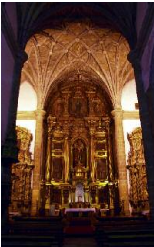
Retablo de la Iglesia de San Miguel