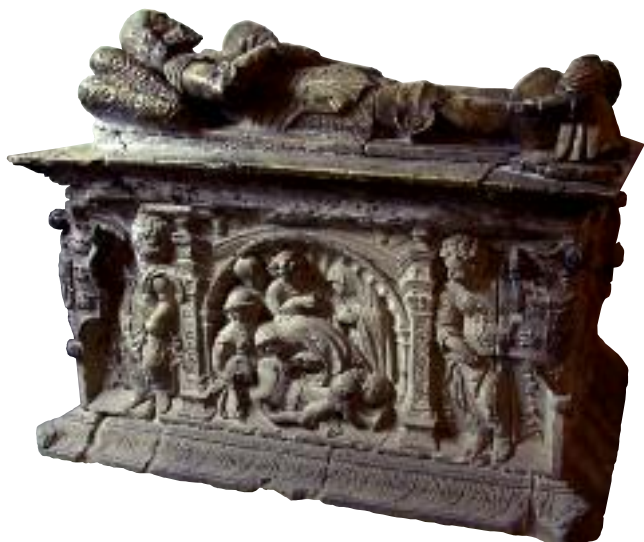
Sepulchro de los Rueda en la Iglesia de San Miguel

reina Isabel la Católica el 13 de diciembre de 1474. De aquella primera construcción se conservan unas esculturas que han sido reemplazadas por copias en la fachada del templo para mejor conservarlas, y que se muestran en el espacio de acceso por la calle del Cronista Lecea; pueden verse desde el exterior. En el interior, de considerables dimensiones, hay un artístico sepulchro de los Rueda y el del ilustre segoviano Andrés Laguna (1499-1559), científico y humanista, médico en la corte de Carlos V y de los papas Paulo III y Julio II, autor de los comentarios al libro "Materia médica", de Dioscórides, y del famoso "Discurso de Europa".