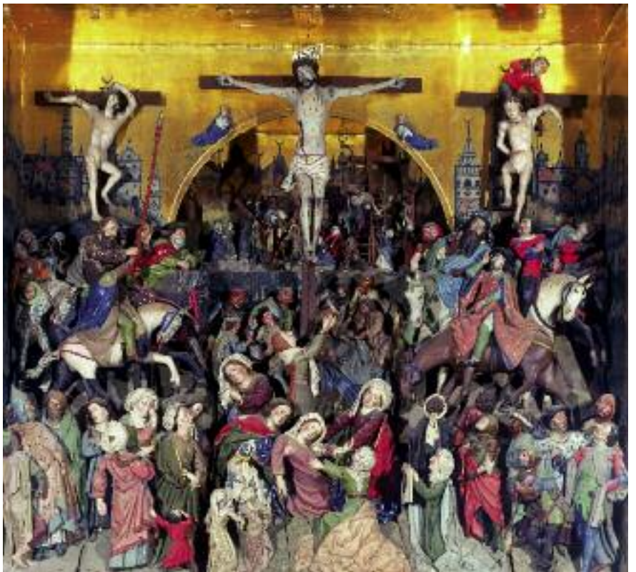
Retablo del Calvario en el Convento de San Antonio el Real

Subiendo por la avenida del Padre Claret, por un estrecho paseo que discurre junto al inicio del canal del Acueducto, se sale a una explanada en la que se encuentra el Convento de San Antonio el Real , una de las sobresalientes joyas que conserva la ciudad, habitado por Religiosas de Santa Clara. El edificio fue casa de recreo de Enrique IV cuando era príncipe, y al comenzar su reinado, fundó allí un convento de Frailes Franciscanos que, posteriormente, cedieron el monasterio a las Monjas Clarisas. La iglesia posiblemente fuera el salón principal del palacio, con un techo mudéjar que es una auténtica joya. En el mismo templo hay que admirar detenidamente un maravilloso reta-