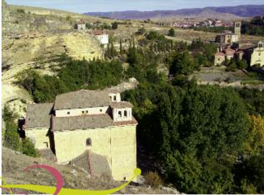
Alameda de La Fuencisla junto al convento de los Padres Carmelitas

JUAN DE YEPES nació en Hontiveros, Ávila, en 1542; posteriormente vivió en Arévalo y Medina del Campo, donde cursó estudios eclesiásticos; vistió el hábito del Carmelo en 1563, ordenándose sacerdote en 1567. Un año después comenzó la tarea de reformar la Orden, adoptando entonces el nombre de Juan de la Cruz. Víctima de falsas calumnias, fue encarcelado, pero escapó descolgándose desde una ventana. En 1579 es rector del colegio de Baeza, luego prior del convento de Granada, vicario general de Andalucía, definidor primero y vicario de la Casa de Segovia. Se retiró al desierto de Peñuela y fue a morir a Úbeda, el 14 de septiembre de 1591. Fue canonizado en 1674. De forma secreta, en abril de 1593 se trasladó su cuerpo desde Úbeda a Segovia, en cuyo convento de PP. Carmelitas se venera. Este hecho se dice que figura recogido en “El Quijote”, donde precisamente se cuenta el traslado sigiloso de un cuerpo desde Úbeda hacia Segovia.