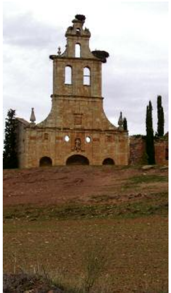
Ruinas del Convento de San Francisco

SAN FRANCISCO DE ASÍS (1182-1226) fundó la Orden de Frailes Menores. Desposeyéndose de todos sus bienes, vistió un sayal y se convirtió en apóstol de los pobres. Fue autor de un maravilloso "Cántico de las criaturas" ó "Cántico del Hermano Sol". Hizo una representación plástica del nacimiento de Jesús, según lo relata San Lucas, y de ahí que se le atribuya la creación de los "belenes".