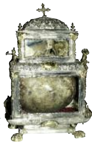
Urna con las cabezas de San Valentín y Santa Engracia, en la Iglesia Parroquial

La tradición, mantenida durante siglos en la provincia, dice que SAN VALENTÍN Y SANTA ENGRACIA eran hermanos de San Frutos -proclamado patrono de la diócesis-, nacido de una familia rica pero que repartieron sus bienes entre los pobres y se retiraron con su hermano al desierto del Duratón, donde habitaron en sendas cuevas haciendo vida de anacoretas; su vida fue segada por los moros y sus cabezas decapitadas se tiraron a una fuente, que la tradición ha dado en designar como tal la llamada Fuente Santa de Caballar. Tomás Calleja amplía noticias y supuestos en el libro mencionado anteriormente sobre las “mojadas”.