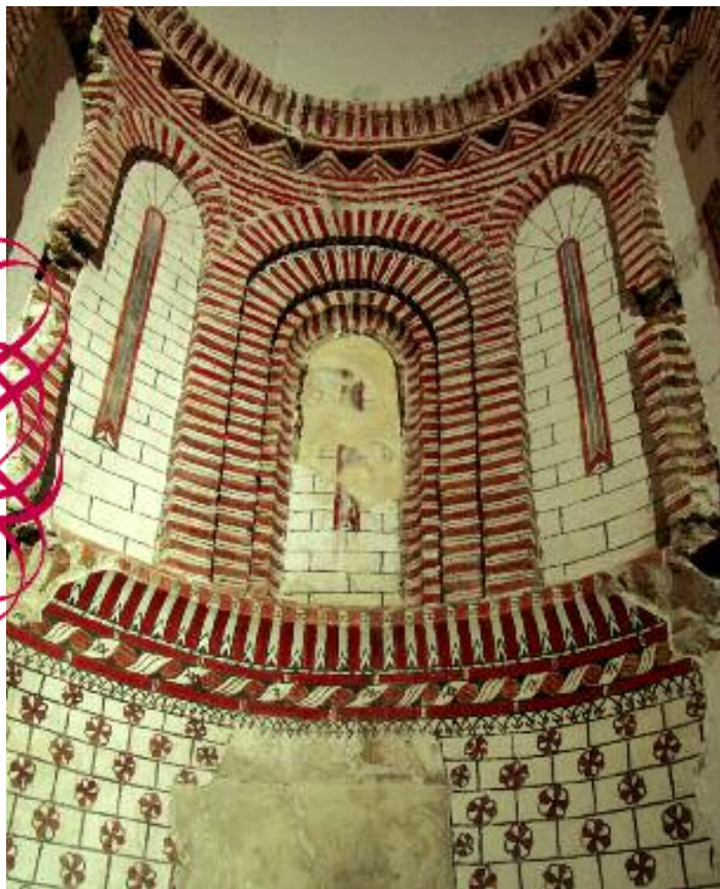
Pinturas murales del ábside de la Iglesia de San Andrés

Aunque no tengan carácter religioso, en Cuéllar hay que visitar también el castillo , Hospital de la Magdalena, sus diversas y antiguas puertas, etc.