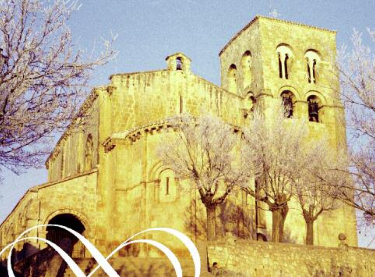
Iglesia de El Salvador