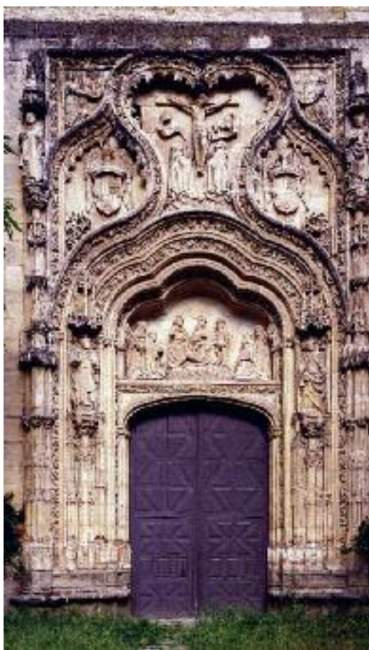
Fachada de la Iglesia del Convento de Santa Cruz la Real

Por el mismo camino que nos trajo hasta el convento de Santa Cruz la Real, regresamos a la amplia y umbrosa Alameda , junto a la que discurre el río Eresma en dirección a la antigua Fábrica de la Moneda (cuya restauración parece estar próxima); en este punto hay que seguir por un empinado y pedregoso camino a la derecha, que nos lleva hasta el famosísimo monasterio de Santa María de El Parral , uno de los dos únicos en España que hoy siguen a cargo de los Monjes Jerónimos (el otro es el Monasterio de Yuste). Se atribuye la fundación a don Juan Pacheco, Marqués de Villena, si bien autor tan documentado como el Marqués de Lozoya afirma que Villena fue fundador de la iglesia, mientras que el monasterio en su conjunto fue un deseo de Enrique IV. La atribución de la fundación a Juan Pacheco se debe a una leyenda que cuenta que existiendo en las proximidades de este lugar una capilla dedicada a la Virgen, fue punto elegido para un desafío entre Villena y otro caballero; este último se presentó acompañado de dos personajes, ante lo que el marqués, mientras desenvainaba su acero, dijo: "Traidor; no te valdrá tu traición, pues si uno de los que te acompaña me cumple lo prometido,