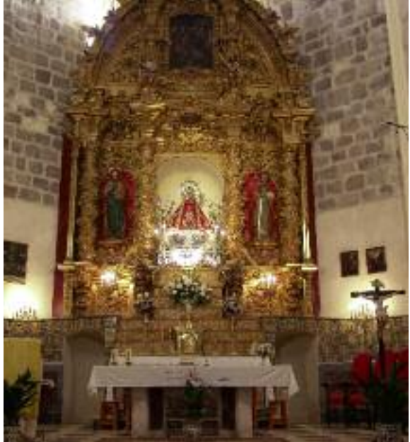
Altar Mayor de la Iglesia del Monasterio con la Virgen de Soterraña

En honor de la Soterraña se celebra una muy original fiesta llamada “de los cirios”, en los primeros días de septiembre.