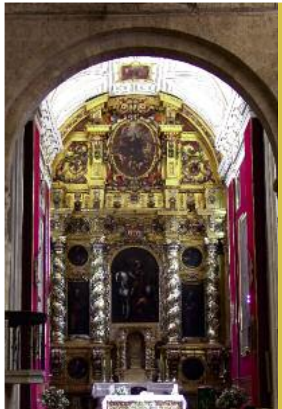
Retablo de la Iglesia de San Martín