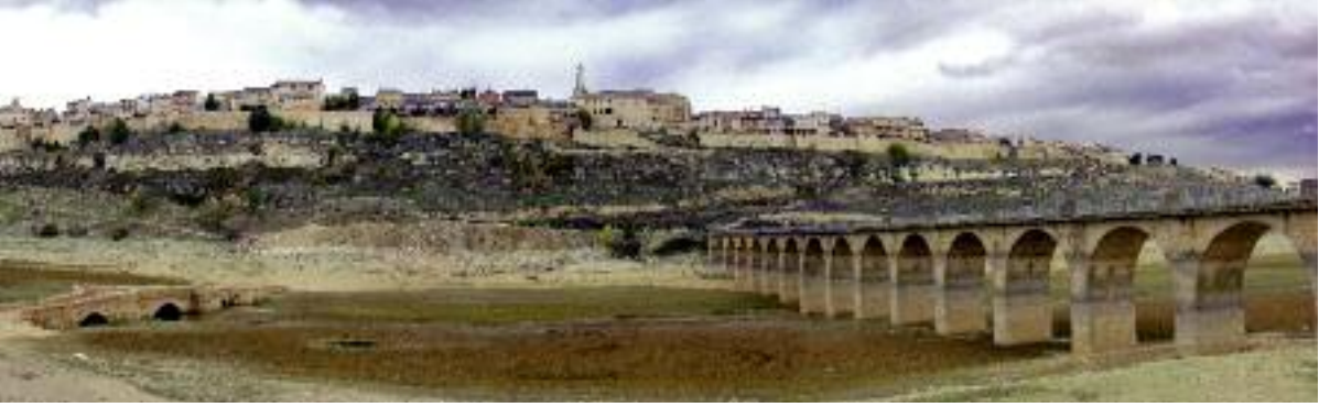
Panorámica de Maderuelo