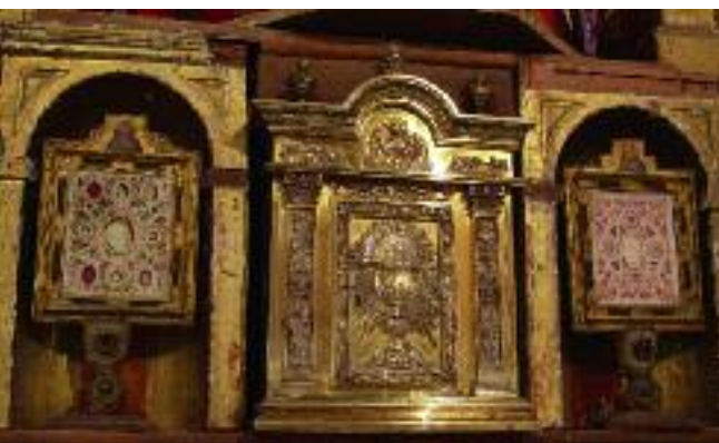
Sagrario y relicarios de la Iglesia de El Salvador

Los primeros escritos sobre su origen datan de mediados del siglo XII. Cuenta con dos parroquias. La iglesia de Santa María la Mayor , situada en el centro del recinto urbano, tiene restos del siglo XII de su primera construcción; dos portadas, la del Norte, del gótico flamígero en piedra caliza, que es la principal, y la del mediodía, también gótica pero de piedra roja. El interior es gótico, con tres naves, pertenecientes ya al siglo XVI, y es muy digno de observar el bajo coro, de 1535. Destaca el altar de las Angustias, con un bello grupo escultórico de La Piedad debido a Pedro de Bolduque en el que se observa un detalle curioso, y es que uno de los hombres tiene en la mano una espina de la corona, que enseña a María. También del gótico florido es el púlpito de piedra caliza, cuya procedencia se ignora. Entre las valiosas obras de orfebrería destacan la custodia, de Diego de Olmedo (gótico del XVI) y una cruz parroquial considerada como la más bella obra de Francisco Ruiz. También se conserva otra cruz parroquial de Oquendo que perteneció a la parroquia de El Salvador.