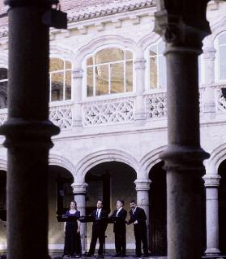
Patio del antiguo Convento de San Francisco

Desde los pies del Acueducto subimos por la calle de Teodosio el Grande (emperador romano nacido en la villa segoviana de Coca), paralela al monumento, para llegar ante el edificio de la Academia de Artillería , que originariamente fue Convento de San Francisco , del que se conserva un bello patio. Pasamos bajo el gigantesco monumento y nos encontramos en la plaza de Día Sanz (uno de los legendarios capitanes segovianos que conquistaron Madrid), en cuyo centro aparece una gran fuente de granito. Frente a ella, haciendo esquina a la calle de San Alfonso Rodríguez , existe un edificio, sometido recientemente a restauración, en el que una placa indica que en él nació el mencionado santo segoviano. El caserón conserva en su parte superior una galería que era característica en las casas de los tratantes de paños y lanas, y el padre del santo lo era. Alfonso, muertos su esposa e hijos, ingresó en la Compañía de Jesús y fue destinado a Mallorca; en la isla le tienen por Patrono.