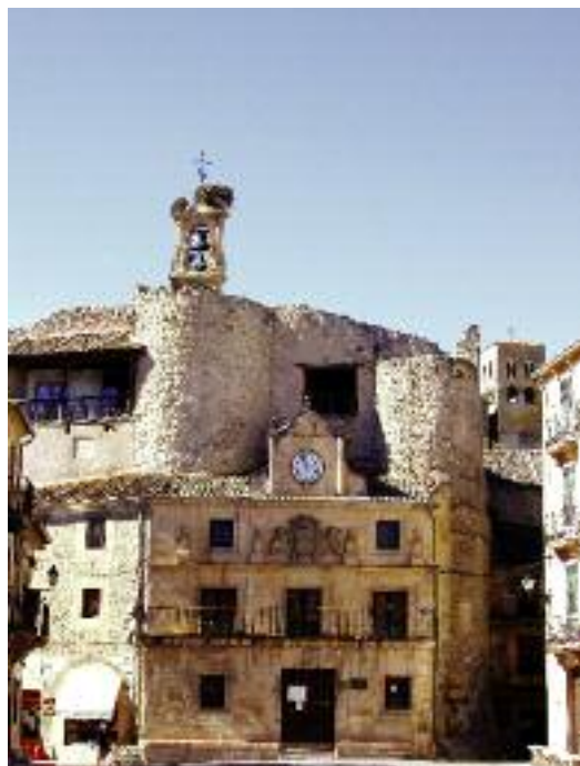
Castillo y Plaza Mayor

Visto desde la distancia, el conjunto urbano de esta villa es uno de los más bellos que pueda contemplarse. Es poseedora de un famosísimo “Fuero de Sepúlveda”, otorgado por Sancho García. En su interior conserva muchos recuerdos de su antiguo pasado, así como una buena colección de iglesias, de un románico anterior al llamado “románico segoviano”. La más sobresaliente es la de El Salvador , fechada en 1093, sobre un cerro que domina la villa. En su interior guarda una custodia en forma de templete. El Santuario de Nuestra Señora de la Peña , Patrona del lugar, es asimismo sobresaliente por su riqueza escultórica. La iglesia de San Justo era la predilecta de los hidalgos y nobles de la villa; en ella se conserva la capilla sepulcral de los González de Sepúlveda; hay que destacar el interés que ofrece su cripta. En la misma Plaza de España hay una escalinata y un sencillo humilladero que orientan hacia el templo de San Bartolomé , el cual guarda una valiosa cruz parroquial del platero segoviano Antonio de Oquendo. También tuvo la Villa de Sepúlveda un notable barrio judío , del que hay pocas muestras.