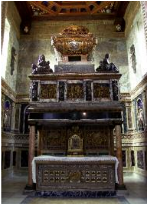
Mausoleo de San Juan de la Cruz en el Convento de los Padres Carmelitas

Este hoy barrio de Segovia, Zamarramala, es universalmente célebre por sus fiestas de las alcaldesas y aguederas, que se celebran en febrero, el domingo más próximo al día 5, en honor de Santa Águeda , con la particularidad de que en esta señalada jornada son las mujeres las que mandan en la colación. Visten la indumentaria antigua segoviana y las dos alcaldesas, con montera y vara de mando, presiden todos los actos. En la procesión con la imagen de la santa, únicamente pueden bailar las mujeres, llevar las andas de la imagen e intervenir en el baile de rueda; con ellas sólo está un hombre, el cura párroco, que suele vestir manto y teja a la antigua usanza religiosa.