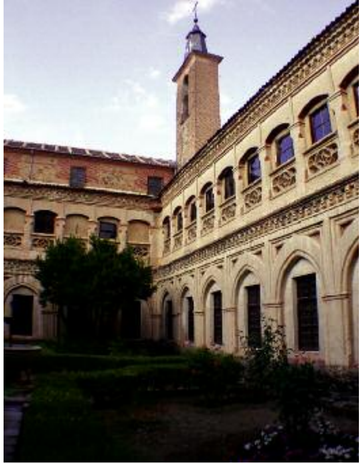
Patio y Claustro del Convento de San Antonio el Real

Por la calle de Cañuelos (por los surtidores o caños de agua que en ella hubo) salimos a la avenida del Padre Claret , a la altura de un monumento dedicado a este santo, frente al edificio del colegio de su nombre, de los Padres Misioneros del Corazón de María. Durante su estancia en La Granja como confesor de Isabel II, San Antonio María Claret venía con frecuencia a la residencia de su congregación, donde predicaba. Entrando a la actual y moderna iglesia, a la derecha hay un pasillo en el que se ha incrustado la celosía que hubo en el primitivo templo y tras la que se retiraba el Padre Claret para orar; la tradición dice que en este lugar hablaba con Jesús y con María.