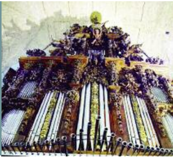
Órgano de la iglesia de San Eutropio