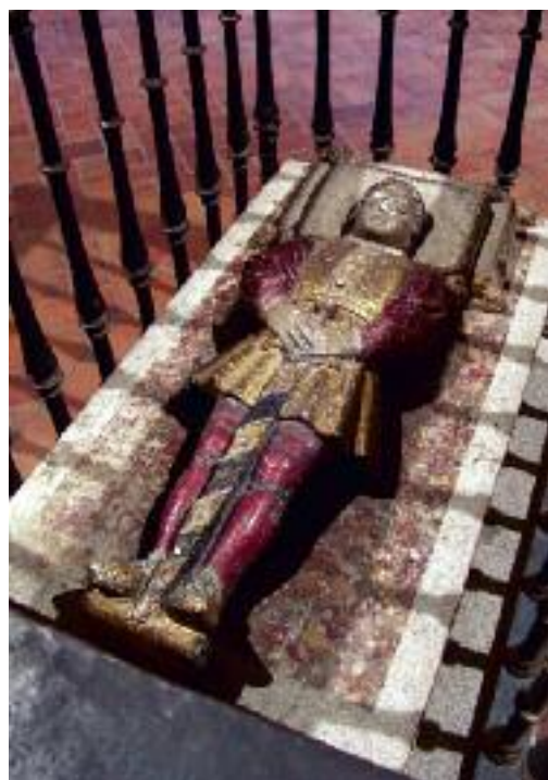
Tumba del Infante Don Pedro

Cruzamos la Plaza Mayor para visitar la Catedral , sobre la que no vamos a entrar en mucho detalle, pues puede visitarse con guías. No obstante, para añadir a lo mucho que puede contemplarse en el templo, cabe señalar que, en el altar del trancoro se encuentra la urna que conserva los restos de San Frutos , Patrono de la Diócesis de Segovia (viajando por la provincia habrá ocasión de visitar su ermita junto a las Hoces del río Duratón), y en el claustro, situada a cierta altura, una inscripción que da fe de encontrarse enterrada allí la judía conversa que fue arrojada desde las Peñas Grajeras, acusada de adulterio, y como se encomendase a la Virgen de la Fuencisla, llegó sana al suelo; se convirtió al catolicismo y aquí tiene su sepultura. En el actual museo (que en fecha próxima va a cambiar de ubicación, ampliándose notablemente en el subsuelo del claustro) está la pequeña tumba con la efigie dorada y estofada del infante Don Pedro , hijo de Enrique II, que cayó al foso desde una de las ventanas del Alcázar, en un descuido de su ama que se arrojó tras él al vacío.