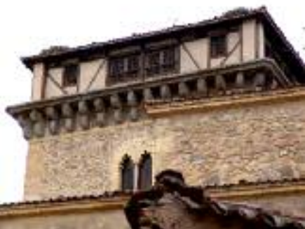
Detalle de la Torre de Hércules en el Convento de las Madres Dominicas

Frente a la iglesia sale la estrecha calle de Adolfo de Sandoval (prolífico novelista segoviano) que lleva a lo que fue barrio de las Canonjías , residencia de los canónigos de la primitiva catedral cuando ésta se encontraba ubicada en lo que hoy son jardines de acceso al Alcázar ; se conserva la Puerta de la Clastra, que daba acceso al recinto y que se sitúa en la hoy llamada calle de Velarde (el capitán que, junto a Daoíz, ambos provenientes del Colegio de Artillería de Segovia, defendió el Parque de Artillería de Madrid ante la invasión napoleónica), por la que nos encaminamos hacia la del Vallejo donde hace pocos años se colocó una estatua de San Juan de la Cruz , obra del escultor José María García Moro; algunos metros más abajo del paseo que lleva el nombre del santo, se conserva una cruc de hierro clavada en una roca en la que una inscripción dice que es creencia general que San Juan descansaba en este lugar cuando subía a la ciudad desde el convento de Padres Carmelitas por él fundado.