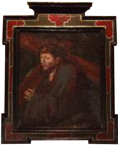
Imagen de Cristo que habló a San Juan de la Cruz, en el Convento de los Padres Carmelitas