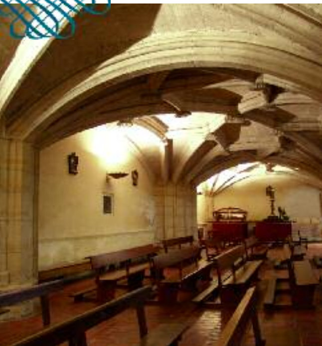
Bajo coro de la Iglesia de Santa María la Mayor