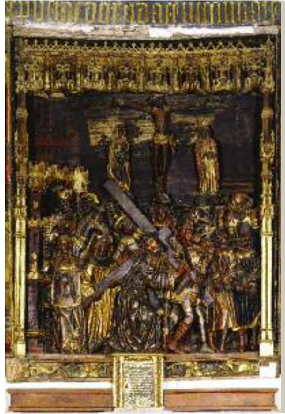
Retablo del Camino del Calvario (h. 1500) en la Iglesia de San Martín