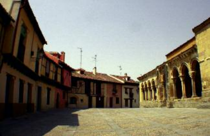
Plaza de San Lorenzo