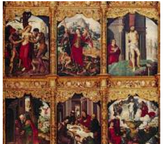
Retablo de la Parroquia de San Juan Bautista

La Parroquia de San Juan Bautista posee un impresionante retablo, obra de los primeros años del siglo XVI, con veintiuna tablas entre pilastras y adornos de madera tallada y estofada.