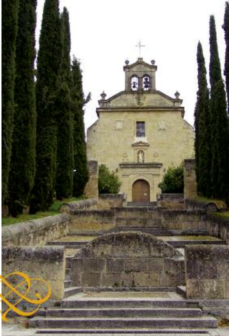
Convento de San Juan de la Cruz de los Padres Carmelitas

Este hoy barrio de Segovia, Zamarramala, es universalmente célebre por sus fiestas de las alcaldesas y aguederas, que se celebran en febrero, el domingo más próximo al día 5, en honor de Santa Águeda , con la particularidad de que en esta señalada jornada son las mujeres las que mandan en la colación. Visten la indumentaria antigua segoviana y las dos alcaldesas, con montera y vara de mando, presiden todos los actos. En la procesión con la imagen de la santa, únicamente pueden bailar las mujeres, llevar las andas de la imagen e intervenir en el baile de rueda; con ellas sólo está un hombre, el cura párroco, que suele vestir manto y teja a la antigua usanza religiosa.