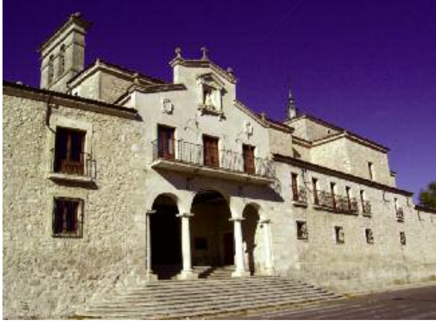
Santuario de Nuestra Señora de El Henar