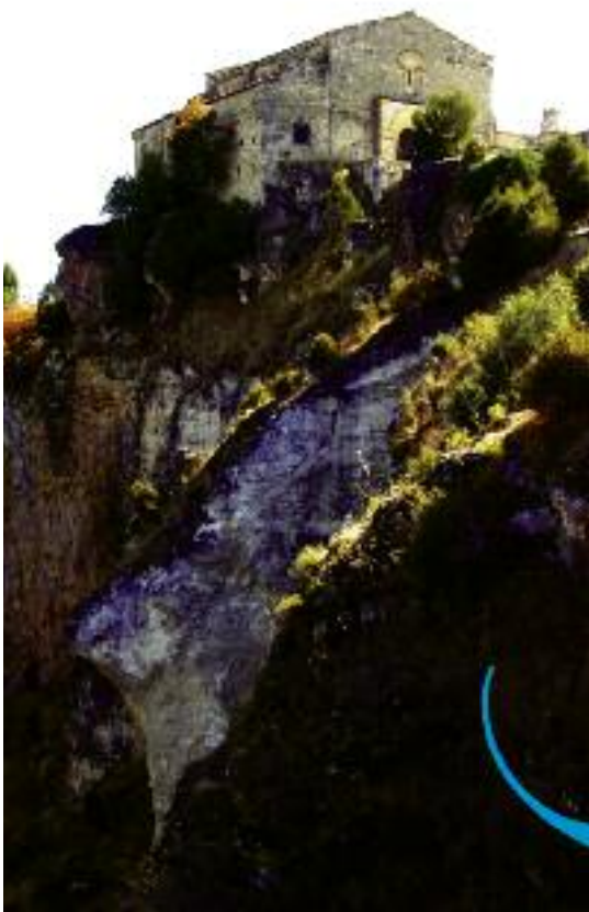
Ermita de San Frutos

En el fondo, junto a uno de los meandros del río Duratón, se contemplan los restos de lo que fue Monasterio de la Hoz, convento franciscano que estuvo dedicado a Nuestra Señora de los Ángeles de la Hoz, fundado siglo y medio después de crearse el Priorato de San Frutos.